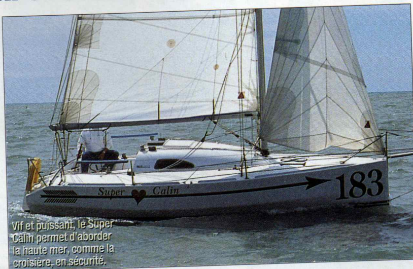
Vif et puissant, le Super Câlïn permet d'aborder la haute mer, comme la croisière, en sécurité.

En conformité avec la jauge série de la classe Mini (il attend d'être construit en dix exemplaires pour être classé comme tel), face au Pogo et au Coco, le Super Câlïn est construit en contreplaqué époxy et se distingue de ses concurrents par une coque à bouchains vifs. Le mât 7/8 e à deux étages de barres de flèche poussantes permet de le régler avec précision, sans trop de risque de démâtage en cas d'erreur de bastaques. Ses caractéristiques en font un voilier performant et très plaisant à mener, avec un volume et des aménagements simples mais suffisants qui permettent sans soucis la croisière à quatre. La finition est très soignée. P. B.