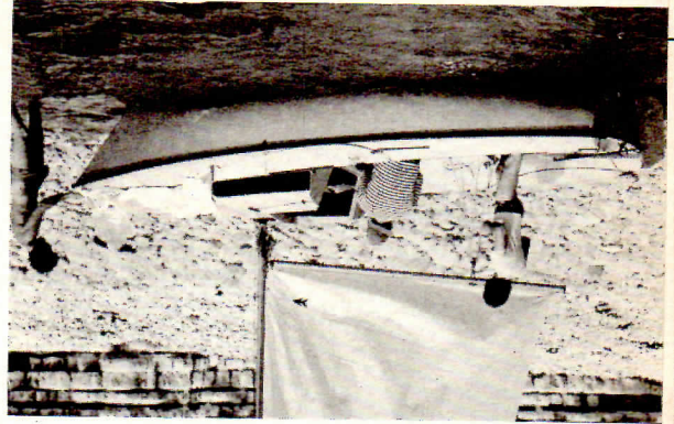
Avec neuf tours de manivelle, la quille est totalement escamotée et le tirant d'eau réduit au minimum. Il ne faut pas oublier, bien sûr, de remonter le safran.

et la stabilité du quillard, l'architecte a choisi Afin de conjuguer la maniabilité du dériveur