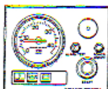
Tableau de bord, alternative «A»